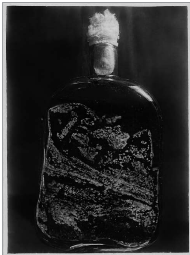
Рис. 6. Рост культуры грибка Penicillium notatum на 4-е сутки в культуральном флаконе (матрасе) для выращивания грибка (по [17]). Собрание Государственного центрального музея современной истории России. ГЦМСИР. Ф 479. ГИК 48575/4. С. 40.

К началу 1944 г. пенициллин уже изготавливали на нескольких заводах. В это же время